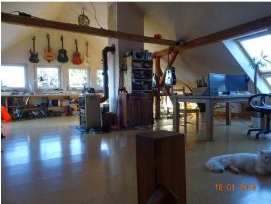
Studio im DG / WE 2