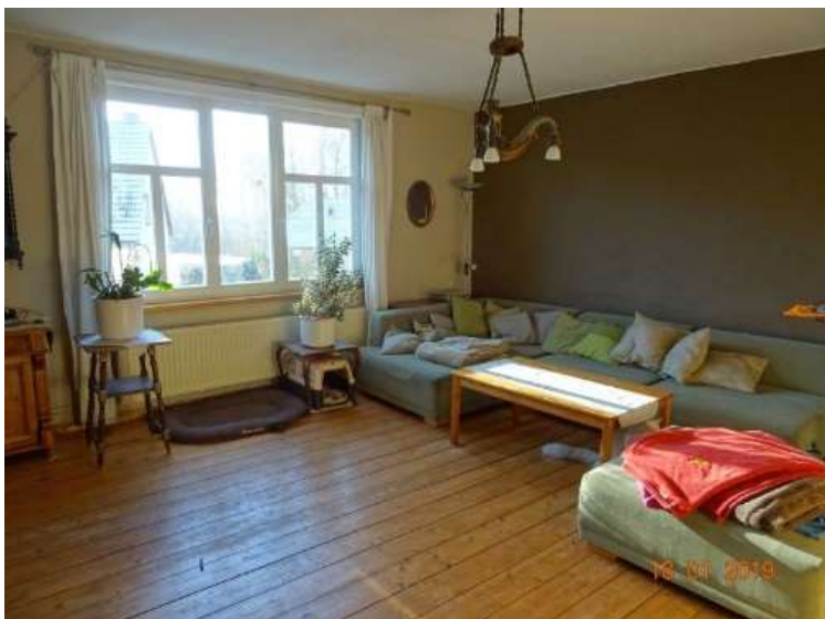
Wohnzimmer im OG / WE 2