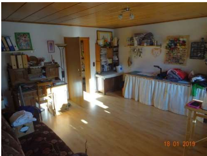
Wohn- Schlafrum 1 im OG / WE 2