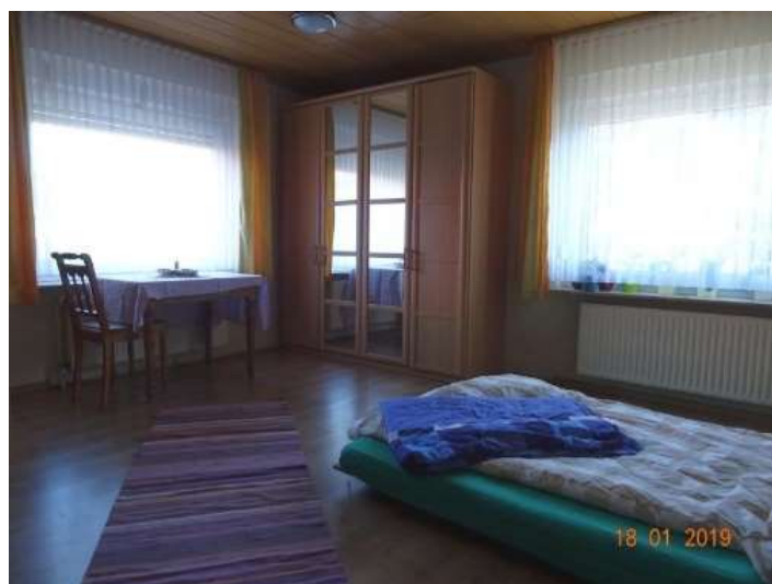
Schlafraum 1 / WE 1