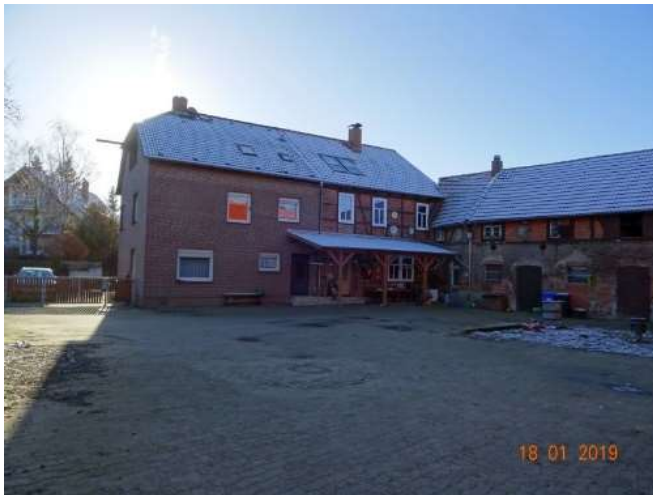
Objektansicht vom Hof mit Eingangsbereich