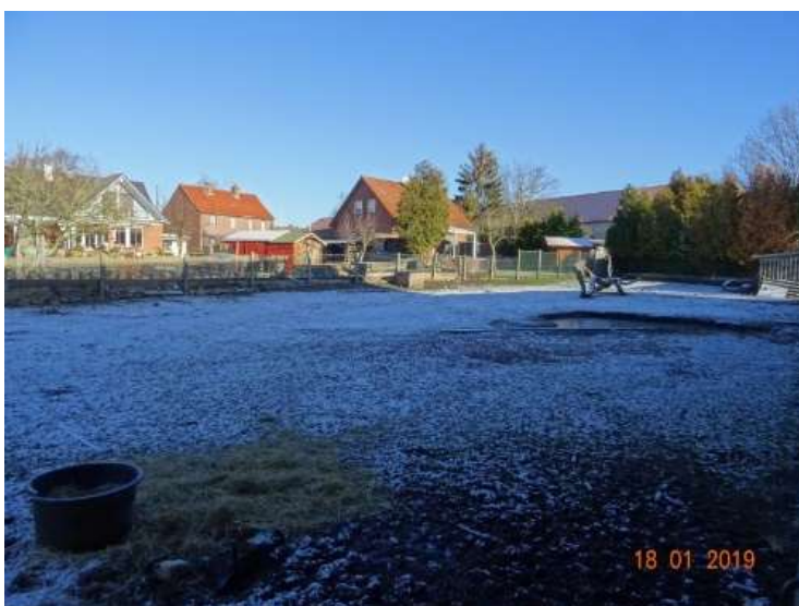
Nutzfläche zur Tierhaltung