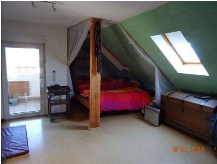
Schlafrum 4 im DG / WE 2