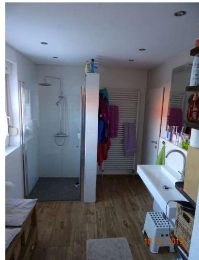
Bad im OG / WE 2