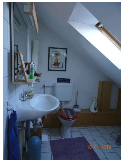
Gäste-WC im DG / WE 2