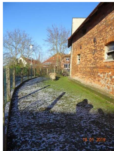
Nutzfläche zur Tierhaltung