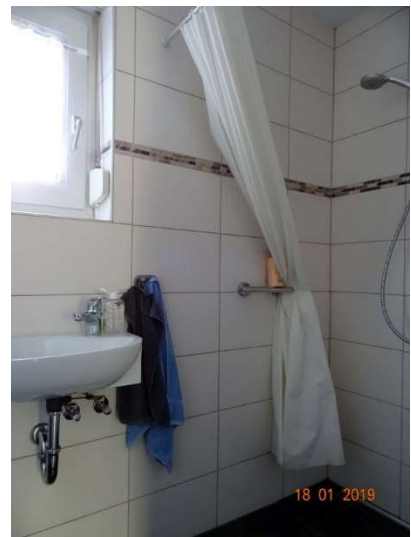
Bad WE 1