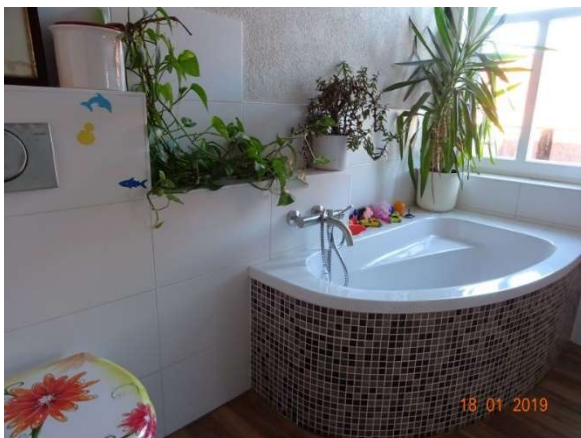
Bad im OG / WE 2