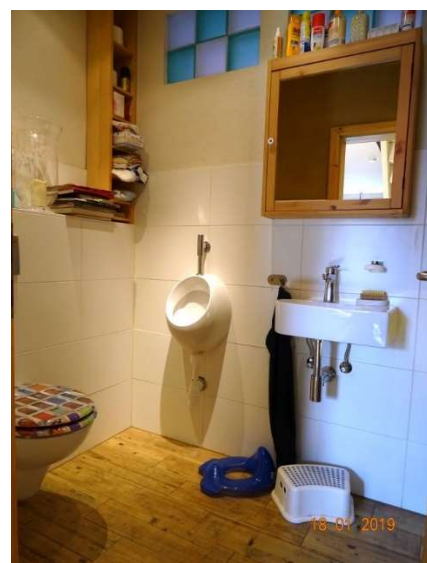
Gäste-WC im OG / WE 2