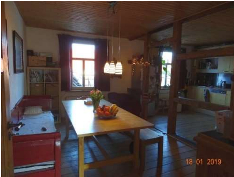
Küche im OG / WE 2