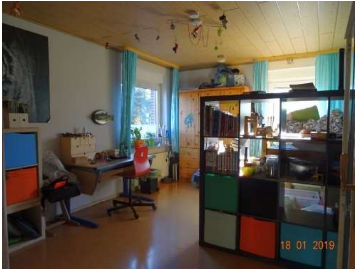
Schlafraum 2 im OG / WE 2