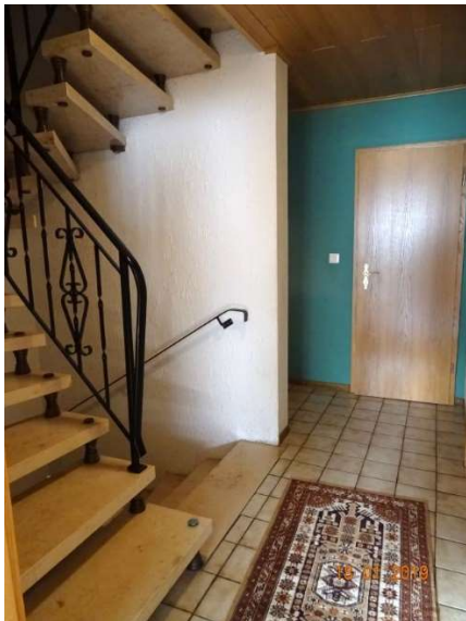
Flur im EG