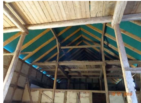
neuer Dachstuhl / Scheune