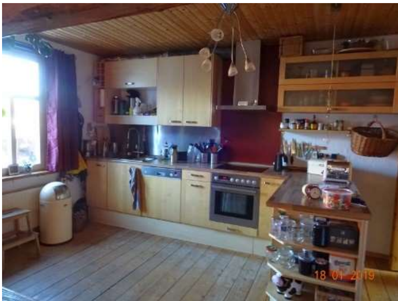
Küche im OG / WE 2