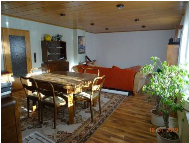
Wohnzimmer WE 1