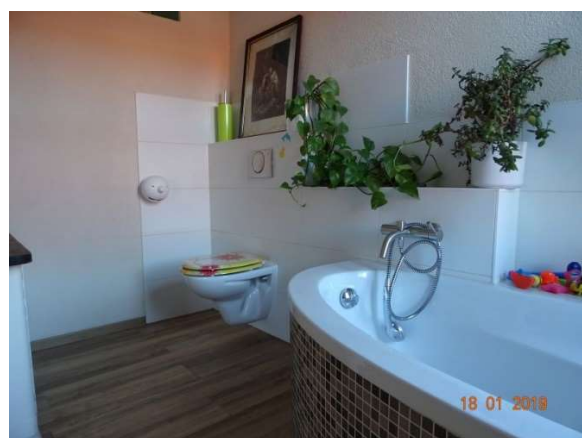
Bad im OG / WE 2