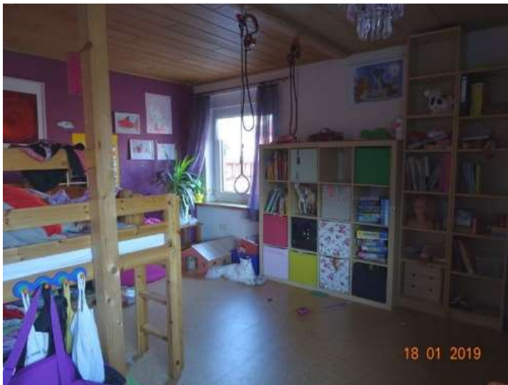
Schlafraum 3 im OG / WE 2