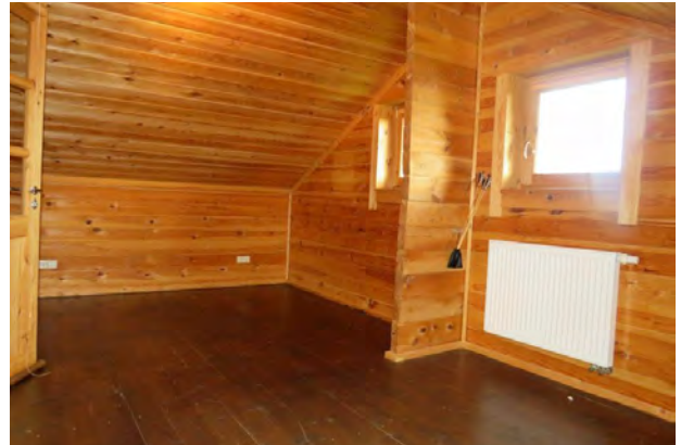
Schlafrum im 2 OG