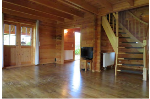
Treppe zum OG