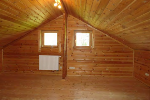
Schlafrum 1 im OG